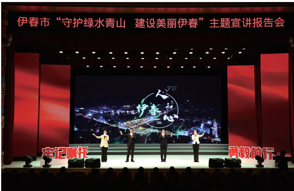
▲“守护绿水青山 建设美丽伊春”主题宣讲报告会

新曲》《黑龙江伊春：“生态富矿”带来产业“甜头”》等2500余篇稿件刊发在新华社、《奋斗》杂志等中央、省级媒体，累计浏览量达5亿次，持续提升“林都伊春·森林里的家”品牌形象。市级主流媒体平台开设“打造‘绿水青山就是