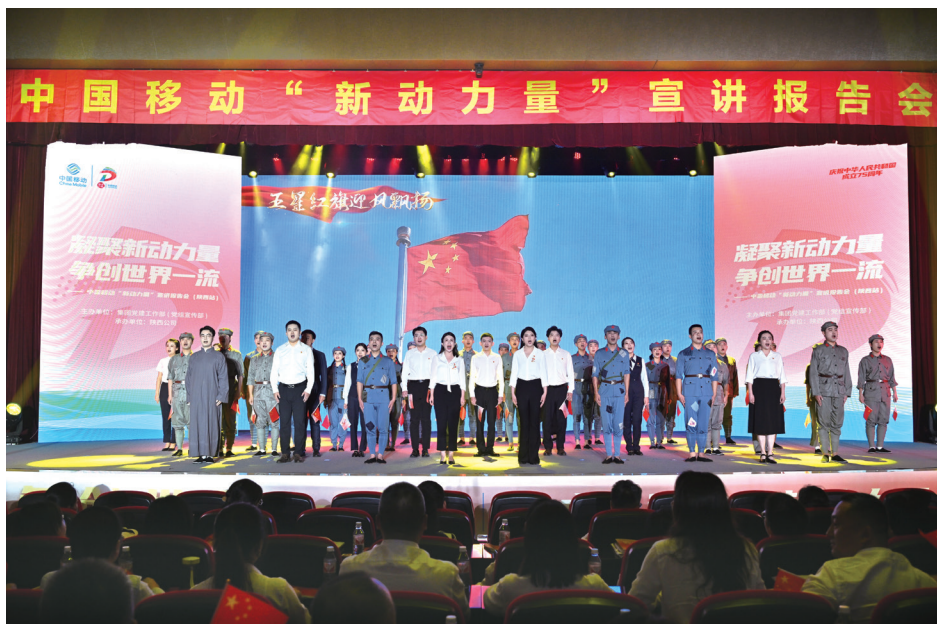
▲中国移动《红色通信 璀璨新生》宣讲剧目在陕西成功首演

坚持系统观念，体系推进聚合力。 中国移动党组深入学习贯彻习近平文化思想，系统推进“新动力量”宣讲团建设，构建起“团、队、组”的组织体系，推动基层宣讲工作有章有序、创新理论传播有力有效、重大决策部署走深走实。一是党组带头示范。加强顶层设计和组织领导，将广泛开展集中宣讲纳入学习宣传贯彻党的二十届三中全会精神工作方案，党组同志结合工作调研等“带课到基层”，带头示范开展宣讲阐释，把全会精神转化为谋划改革的思路、推动发展的举措。研究部署“聚新力·创一流”宣传提升行动，打造“新动力量”宣讲品牌并进行示范宣讲，引导公司上下将党的创新理论与改革发展的具体实践相结合，推动干部员工增进对党的创新理论的政治认同、思想认同、理论认同、情感