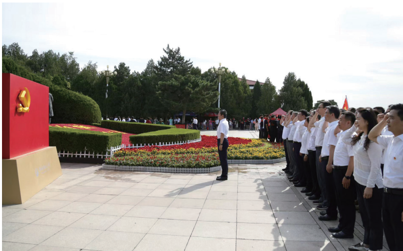
▲赴河北雄安新区和西柏坡开展“七一”主题党日活动

起来、力量统一起来。中国矿产认真落实全面从严治党要求，深入汲取中华优秀传统文化中的“诚信质朴、精益求精、奋发进取”等元素，结合现代企业市场竞争、创新发展需要，进行创造性转化、创新性发展，将“诚朴、精进”作为规范干部职工行为的核心理念纳入企业核心价值观，以人人争创一流推动企业实现高质量发展。